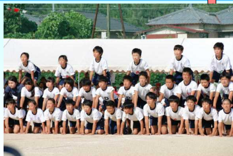
心を一つにして表現