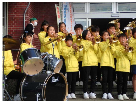
金管バンドクラブ