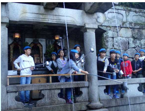
音羽の滝 飲めば効能がある？