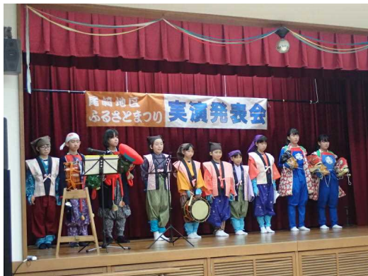
恵比須大黒舞クラブ

子供が何か危険なことやよくないことをしていたらしっかりと叱っていただくよう地域の方への広報でお願いしました。悪い子はいませんが、悪い（いけない）事をすることはあります。その行為をしっかりと叱られることで子供たちはまっすぐに成長していきます。生徒指導は現行犯に限ります。やっているその現場、その瞬間は何の言い逃れも出来ません。3歳にもなれば自分にとって都合の悪いことは、上手に省いてしゃべることを誰もが経験しています。私の生活も都合の悪いことの表現は少なめです。やっている現場を押さえることほど指導力のあるものはありません。一声かけてもらって竹に節があるようにまっすぐに子供たちが伸びていってくれることを望みます。ご理解よろしく申し上げます。