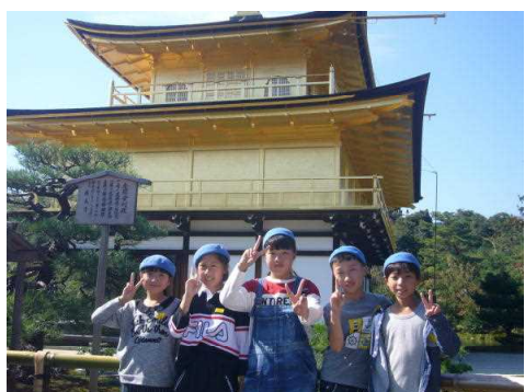
修学旅行 金閣寺前で