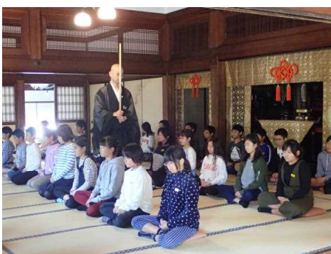
建仁寺での座禅体験