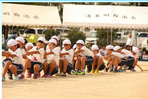
運動会の午後の競技 つなひき